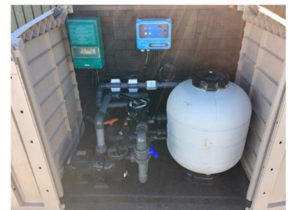
PROTEÇÃO DE EQUIPAMENTOS DE PISCINAS