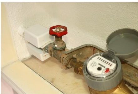
PROTEÇÃO DE CANALIZAÇÕES

Efeito PREVENTIVO Efeito REPARADOR Efeito ANTI-CORROSÃO